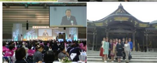
全国商工会議所女性会連合会新潟全国大会参加 上段:左から、鍋茶屋、カーブドッチワイナリー、出席女性会紹介 下段:左から、小林日商会頭挨拶、彌彦神社

[事務局]金沢商工会議所 金沢市尾山町9番13号 TEL076(263)1151 somu@kanazawa-cci.or.jp