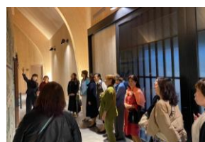
臥龍棟で建築と発泡日本酒について説明を受けました