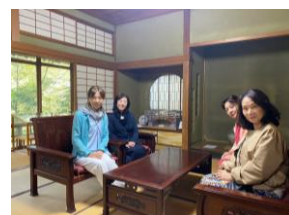
明治末期の最高の技術と逸品に彩られた山中の無限庵