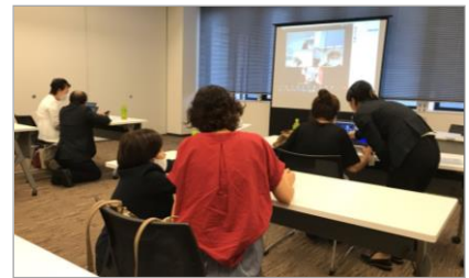
Zoom事前説明会では、(株)スパークル、エキスパート・フラップ(株)の社員の方もサポートしてくれました

今年に入り、思いもよらない新型コロナの感染拡大で社会のシステムは大きく変わりました。オンラインでの会議や研修会、コンサートなどが当たり前の時代に突入し、もう元には戻れない状況です。ビジネスの世界もこれから大きく様変わりしていくでしょう。これからは、Facebook、Instagram、YouTubeをうまく使いこなし、ビジネスに活用できるかが問われる時代になります。今後、2回シリーズで、SNS活用のプロがオンラインで有効なセミナーを実施しますので多くの皆様のご参加を心からお待ちしております。