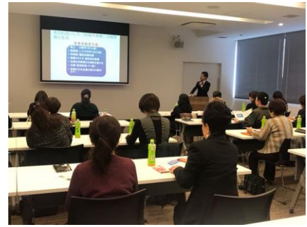
畠先生の話を熱心に聞く会員ら

を注がなかったこと、只々自分は前だけを見て走り、次の人は自分の後ろ姿を見て自覚を！と自分の中で勝手に思っておりました。気が付くと、これでは先がないことに、今更ながら反省しています。